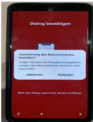
3. Akkuverbrauch optimieren zulassen