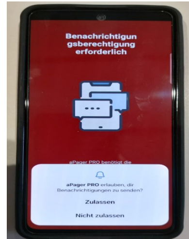
2. Benachrichtigungen zulassen