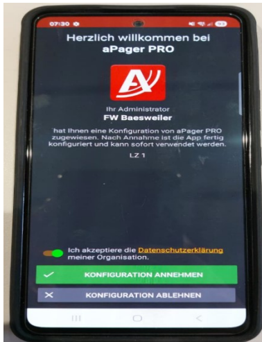
1. Konfiguration annehmen