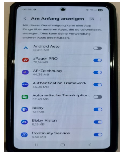
4. App Genehmigung